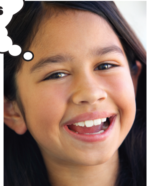
Relaxed | Relejado